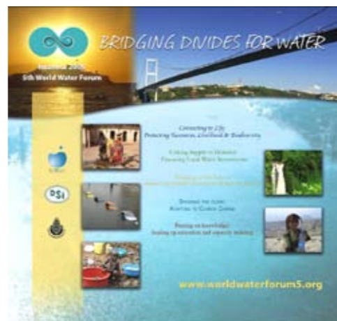
Stand du 5ème Forum mondial de l'Eau

Expo Zaragoza 2008 et le Conseil mondial de l'eau ont un objectif commun : sensibiliser, du grand public aux décideurs politiques, aux enjeux de l'eau pour l'avenir de notre planète. Car, si nous, européens, n'avons qu'à tourner le robinet pour voir l'eau couler, 1.1 milliards de personnes dans le monde – soit 2 fois la population de l'Union Européenne – n'ont toujours pas accès à l'eau potable.