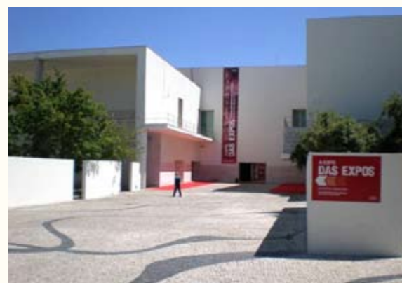
EXPO x EXPOS à Lisbonne, Parque das Nações Expo'98, juin 2008