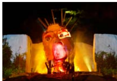
Iceberg. Symphonie poétique et visuelle

La cadence du programme des spectacles dans le temps souligne les contenus en contribuant ainsi à renforcer, par son langage spécifique, les messages de cette exposition engagée dans l'un des plus grands défis de notre temps.