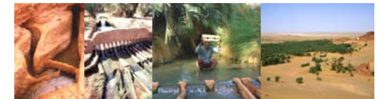
Système hydraulique souterrain, distribution de l'eau et le maître de l'eau de l'oasis

Directeur et coordinateur de IPOGEA, architecte et urbaniste, consultant à l'UNESCO