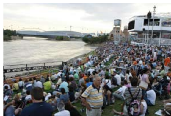
En attendant le spectacle...