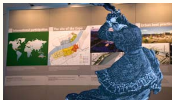
EXPO x EXPOS « Les Expos et leur histoire » à Madrid, Teatro Circo Price, avril-mai 2008