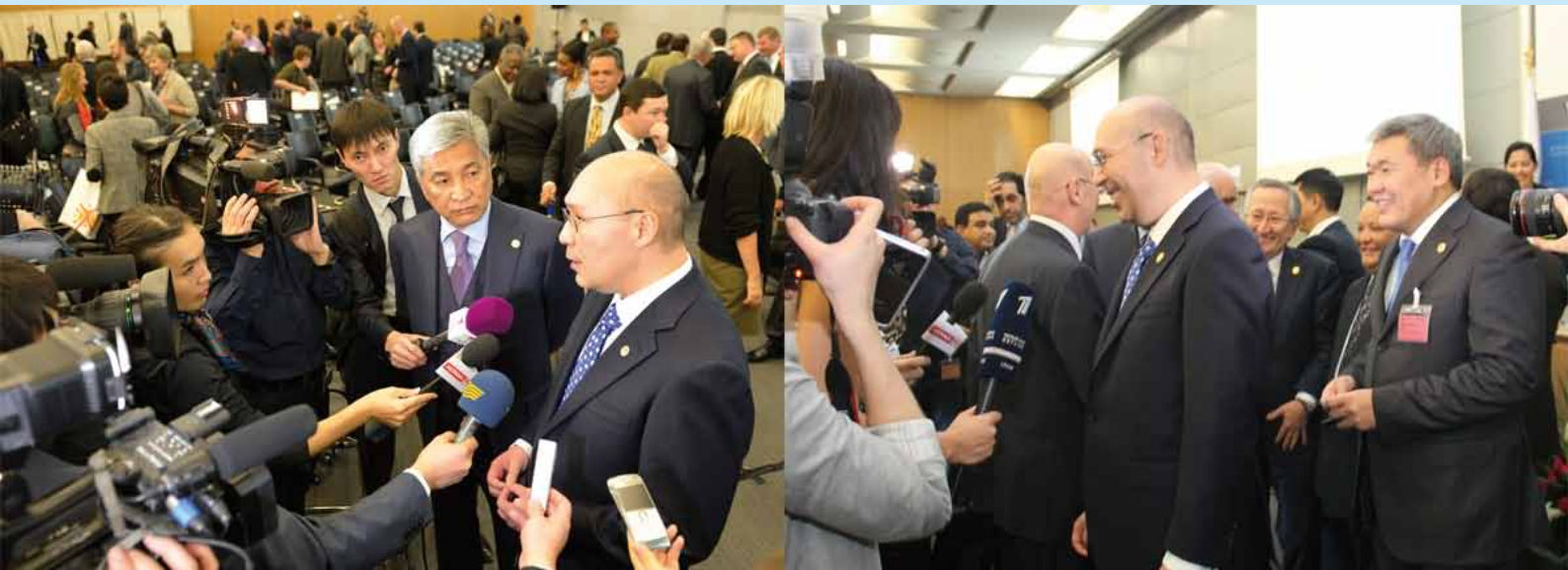
Imangali Tasmagambetov, Maire d'Astana et Kairat Kelimbetov, Vice Premier Ministre du Kazakhstan