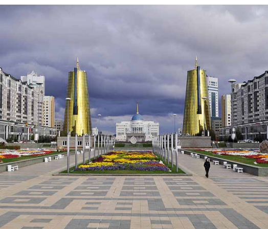
Le palais présidentiel

Capitale administrative et plateforme économique, Astana est située au centre du Kazakhstan, sur la rive droite de l'Ichim. Jadis petit village indépendant au milieu des steppes, Astana est aujourd'hui considérée comme la ville du futur où toutes les idées et tous les rêves peuvent devenir réalité.